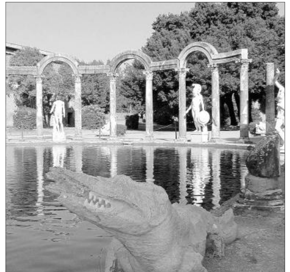
► Detalle de un estanque de Villa Adriana, una enorme residencia que el emperador se hizo construir a 23 kilómetros de Roma.