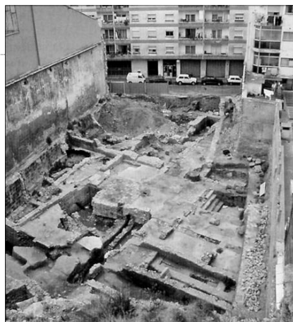
► Las termas romanas de Sant Miquel, hoy tapadas, vistas desde la calle Zamenhoff.

A mediados de las década de los noventa, hace unos quince años, se descubrieron unas termas romanas en la calle Sant Miquel en muy buen estado de conservación. Aunque en 2001 la Generalitat anunció que dos años más tarde estaría en condiciones de inaugurarse un parque arqueológico formado por el conjunto Teatre y Termes de Sant Miquel, lo cierto es que éstas continúan cubiertas con la finalidad de preservarlas. Las termas se extienden por una superficie de 800 metros cuadrados, si bien en su totalidad abarcaban 3.000. Fueron levantadas en el siglo III. Se trata de termas imperiales, lo que significa que en su construcción se siguió el modelo aplicado en Roma.