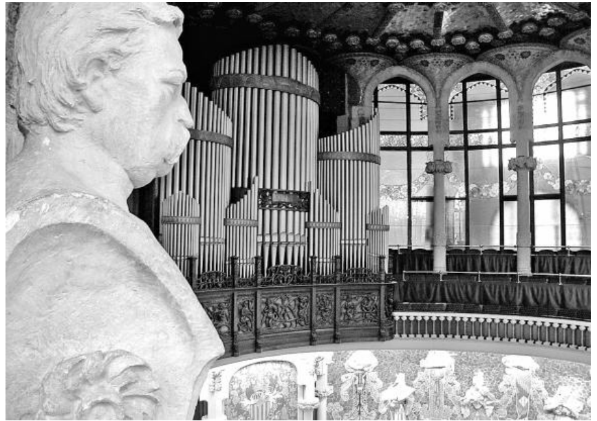
Un busto de grandes proporciones le recuerda en el Palau de la Música Catalana.

Nació en 1824. Republicano de izquierdas. Acercó la música a la clase trabajadora