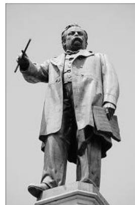
Estatua de Clavé que se levanta en Barcelona.

Clavé fue de nuevo detenido y deportado a Madrid en 1867, pero en esa ocasión los bailes, conciertos en plena calle y teatros,