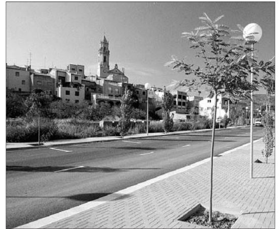
Imagen de la población de Maspujols, cuna de Anglès.

Anglès, que bien le conocía, dijo: «Su limitación estuvo en querer abarcarlo todo y reformarlo todo».