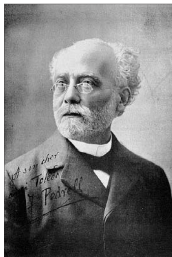
El compositor tortosino Felip Pedrell.

En cierta ocasión, escribió: «Ni en Catalunya ni en el resto de España se me ha hecho justicia. Se ha querido rebajarme constantemente diciendo