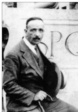
Imagen del arquitecto tarraconense Josep Maria Jujol.