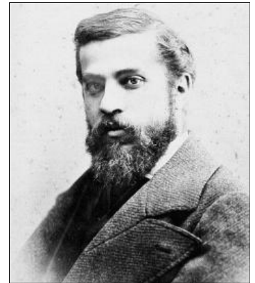
Retrato del genial arquitecto modernista en su juventud.

Esta pasión hizo que en 1879 se hiciera socio del Centre Excursionista de Catalunya y que de ma-