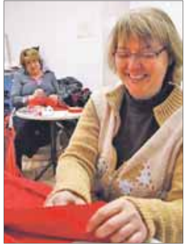
Las costureras del Esbart Dansaire Santa Llúcia. PERE FERRÉ

Las collas de Carnaval de Reus, a toda prisa P 48