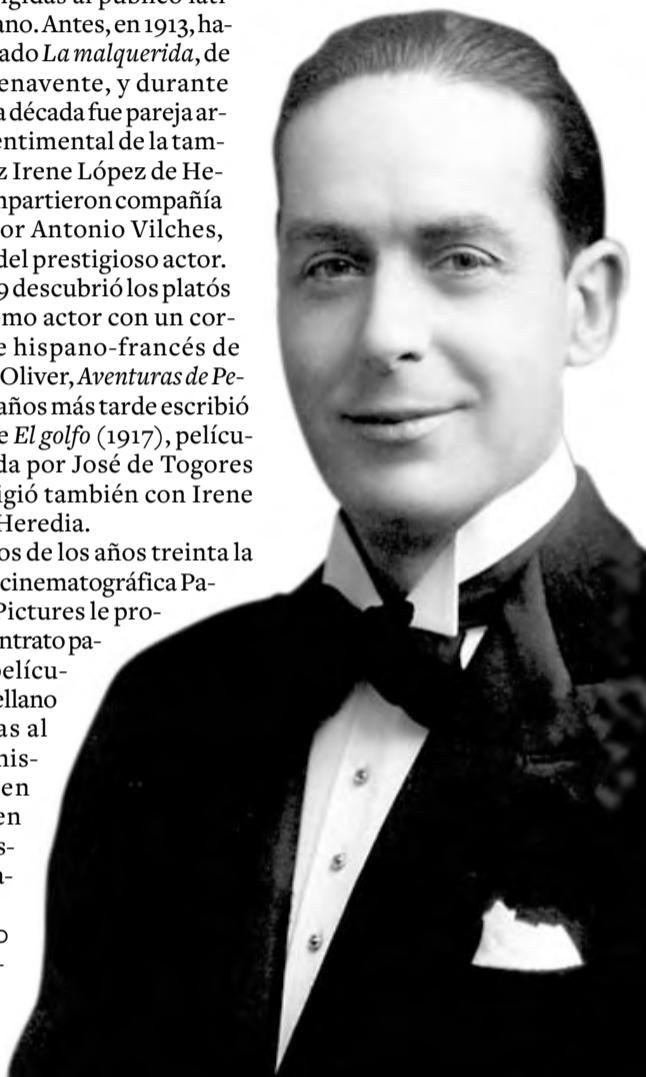
► El actor tarraconense cultivaba el papel de galán con extraordinaria elegancia.