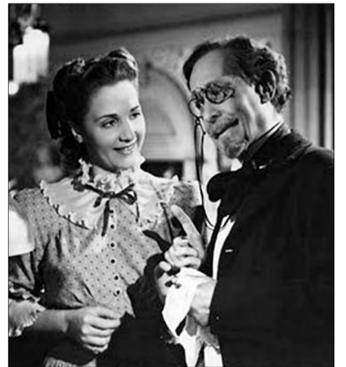
► En 1947, a la edad de 68 años, en 'La cumparsita'.

El entrevistador le preguntó por personajes que conoció en