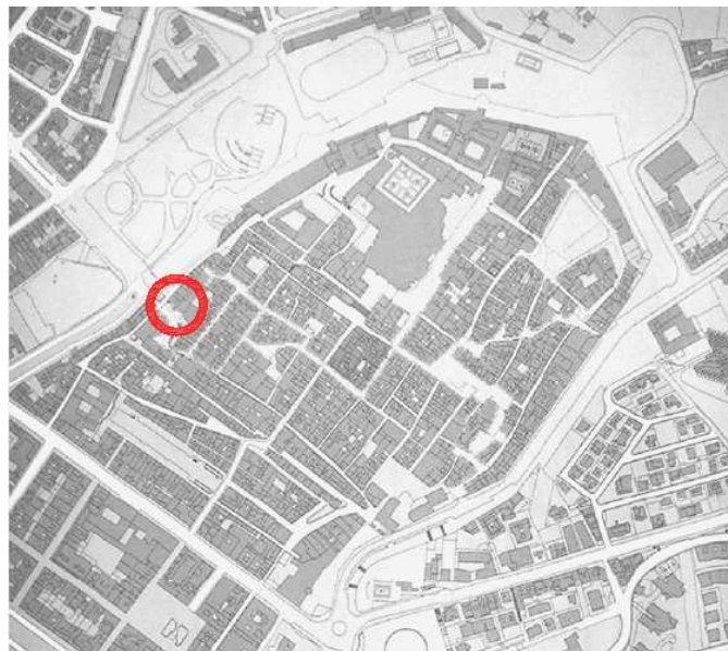
Plànol de situació

L'Oficina del festival estarà situada a la primera planta