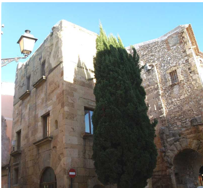
Casa Sefus (a la Plaça del Pallol)

L'Oficina del festival estarà situada a la primera planta